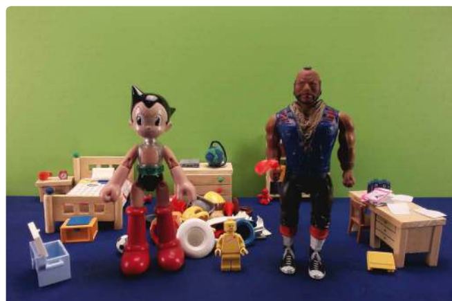
Extraits du clip réalisé en stop motion