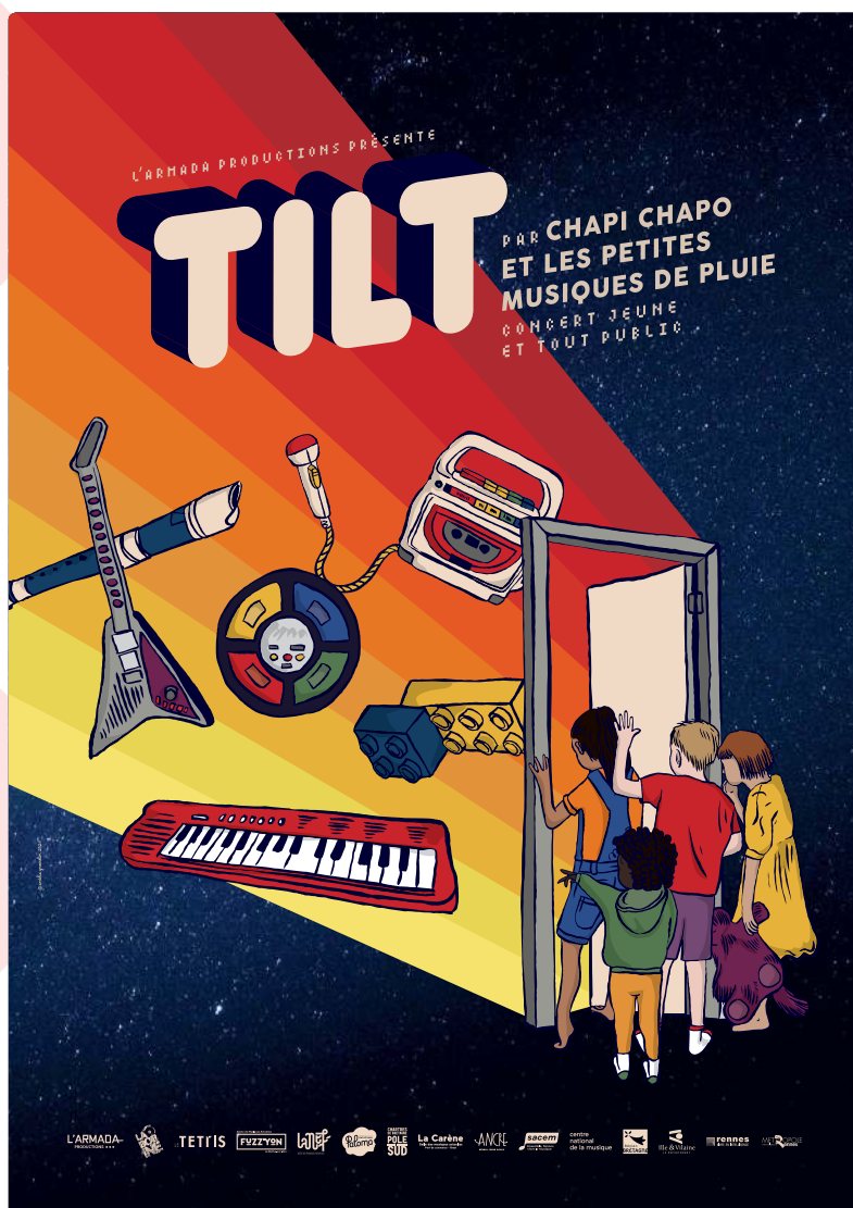
Affiche du spectacle réalisée par Amélie Grosselin

À l'aide de jouets vintage et amplifiés, guitares toy et mini synthétiseurs, les artistes interprètent une partition multicolore qui navigue entre rock, électro et pop music !